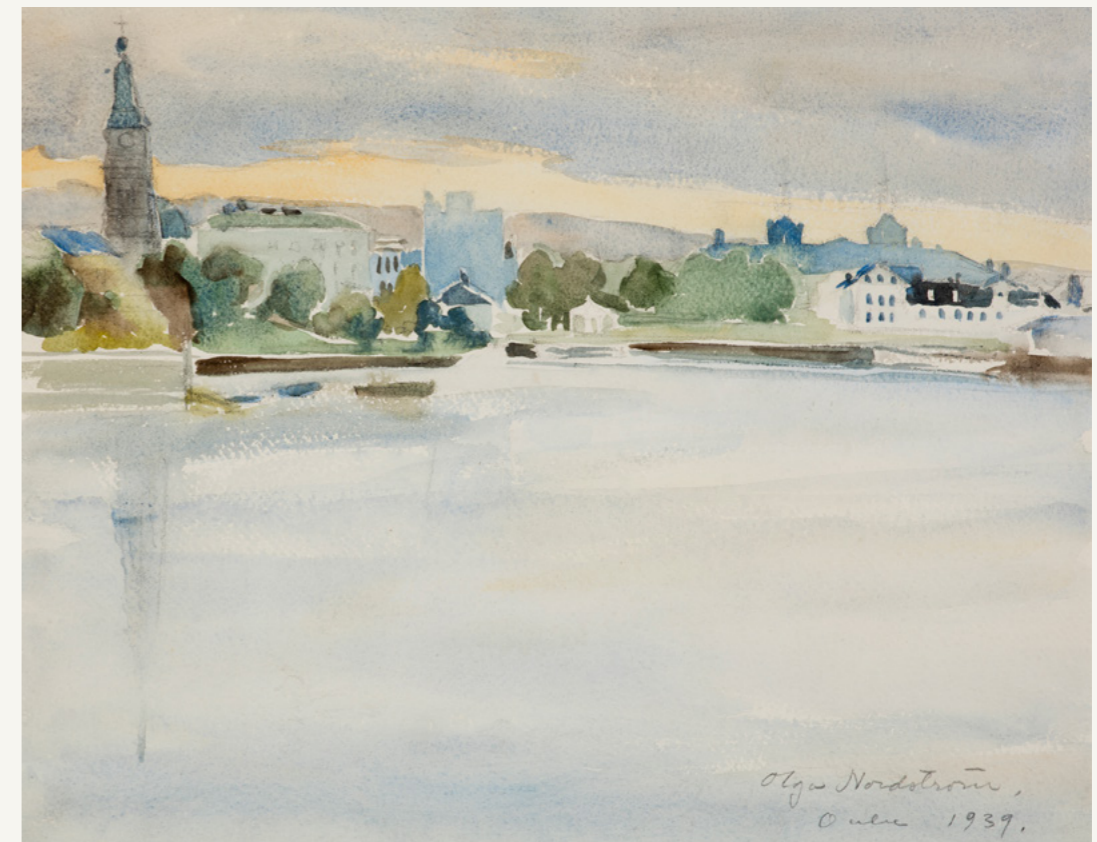
Olga Nordström: Oulu, 1939, vesiväri paperille, 33 cm x 40 cm. Oulun taidemuseon kokoelma.

Myöhemmin, taideopintojensa aikaan ja niiden jälkeen Oulussa oleskellessaan Olga Nordströmin maalasi toistuvasti Nordströmin talon nurkkahuoneen ikkunasta kaupunkiin päin näkyvää maisemaa. Toinen maalauspaikka oli Pikisaaren niemessä, pyykkirannasta avautuvan näkymän maalaaminen.