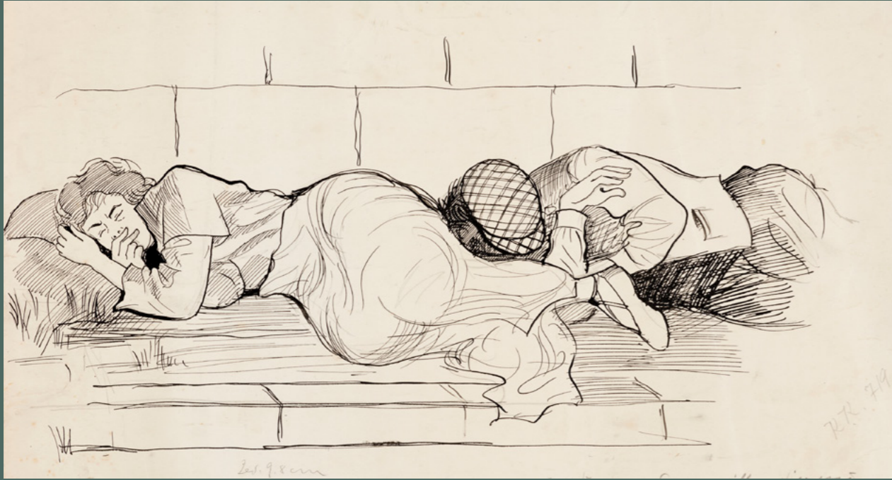
Saimi Törmänen: Seinen sillan vieressä, 1931, lyijykynä ja tussipiirros paperille, 34 cm x 43 cm. Oulun taidemuseon kokoelma.