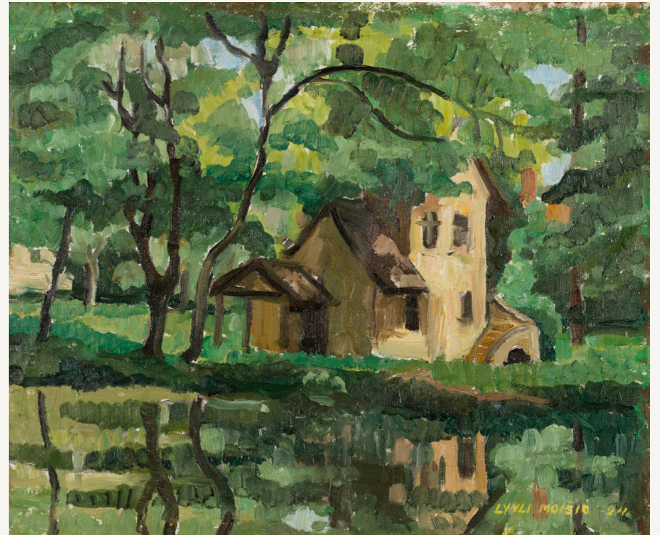
Lyyli Moisio: Versailles, 1924, öljymaalauk kankaalle, 37,5 cm x 45,5 cm. Oulun taidemuseon kokoelma.