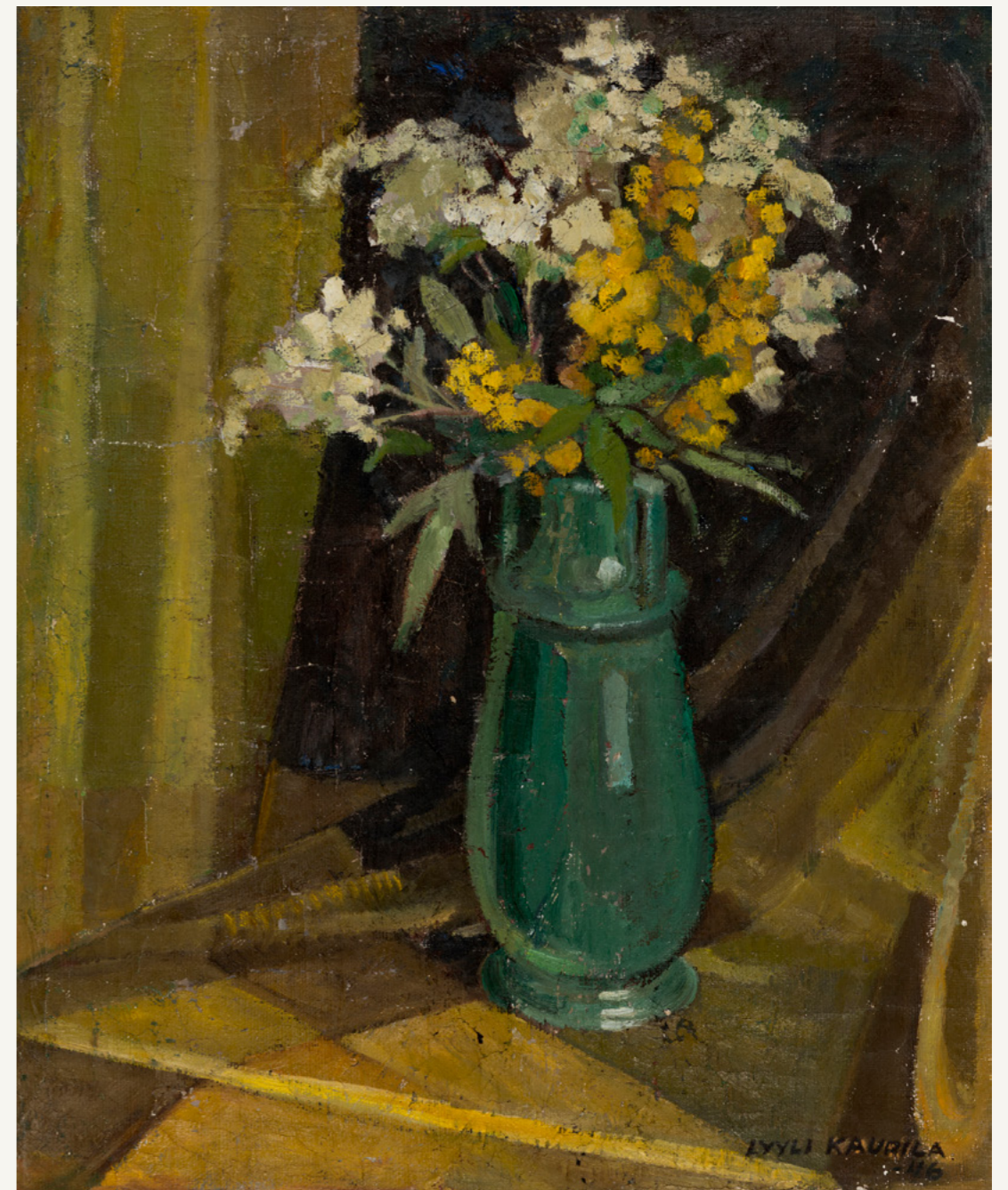
Lyyli Kaurila: Kukka-asetelma, 1946, öljymaalauk kankaalle, 59 cm x 46 cm. Oulun kaupungin kokoelma.

Dukaatti, Suomen taideyhdistys 1846–2006. 2006. toim. Kallio, Rakel. Suomen Taideyhdistyksen julkaisuja. Helsinki. WSOY.