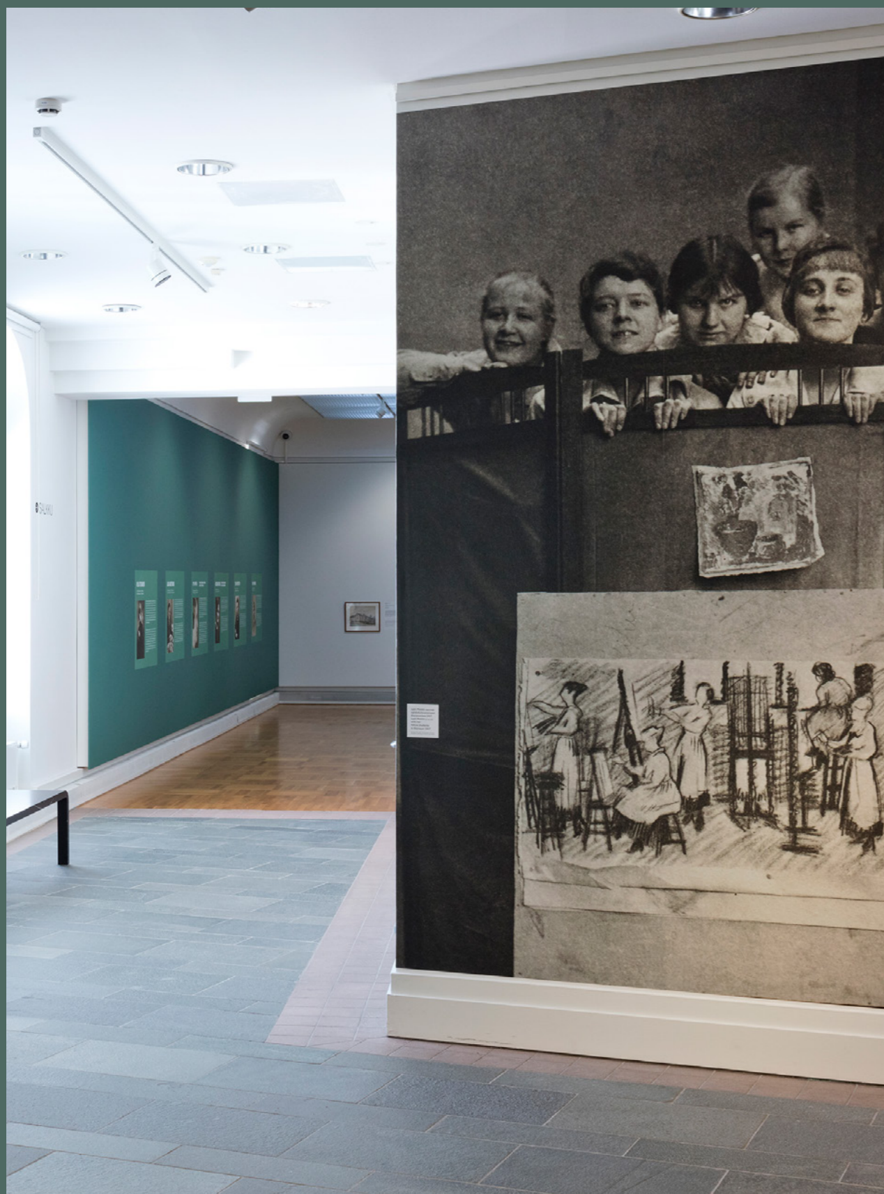
Näkymä Tahto ja taito – 1900-luvun taiteilijanaisia -näyttelyyn Oulun taidemuseossa. Oikealla kuvasuurennos Lyyli Moisioin opiskeluajoilta Ateneumista, alkuperäinen kuva taiteilijan perhealbumista.