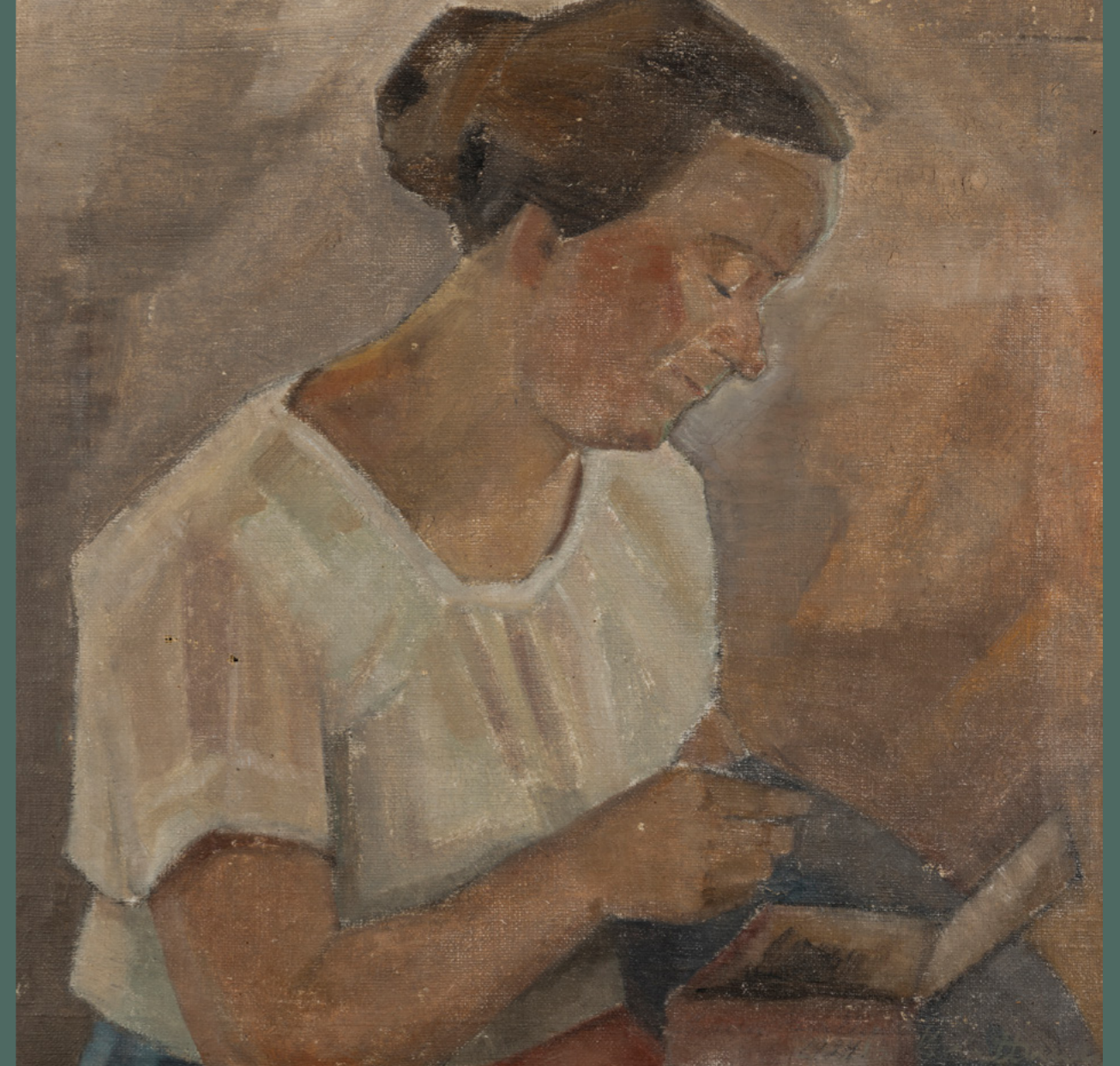
Laila Karttunen: Toini, 1924, öljymaalaus kankaalle, 61 cm x 61 cm. Yksityiskokoelma.