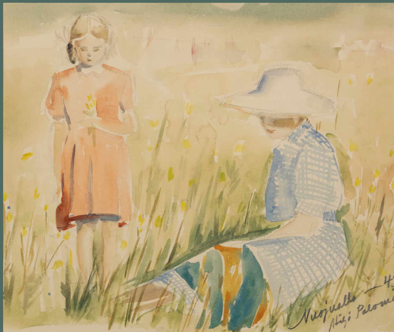
Hilja Palomäki: Kesän mentyä, 1949, vesiväri paperille, 43 cm x 49,5 cm. Yksityiskokoelma.