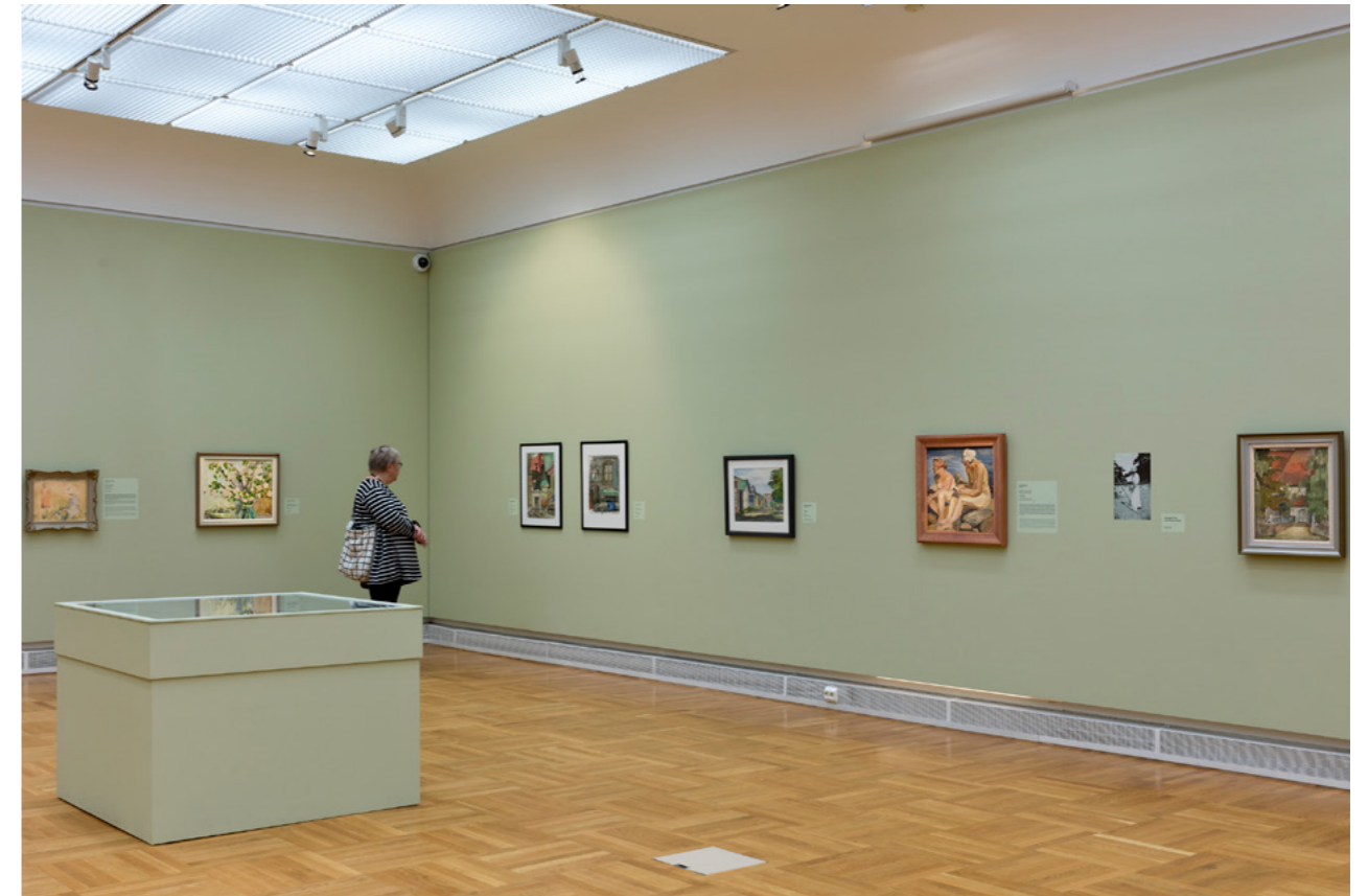
Näkymä Nainen katselee maisemaa -teemaan Tahto ja taito -näyttelyssä.