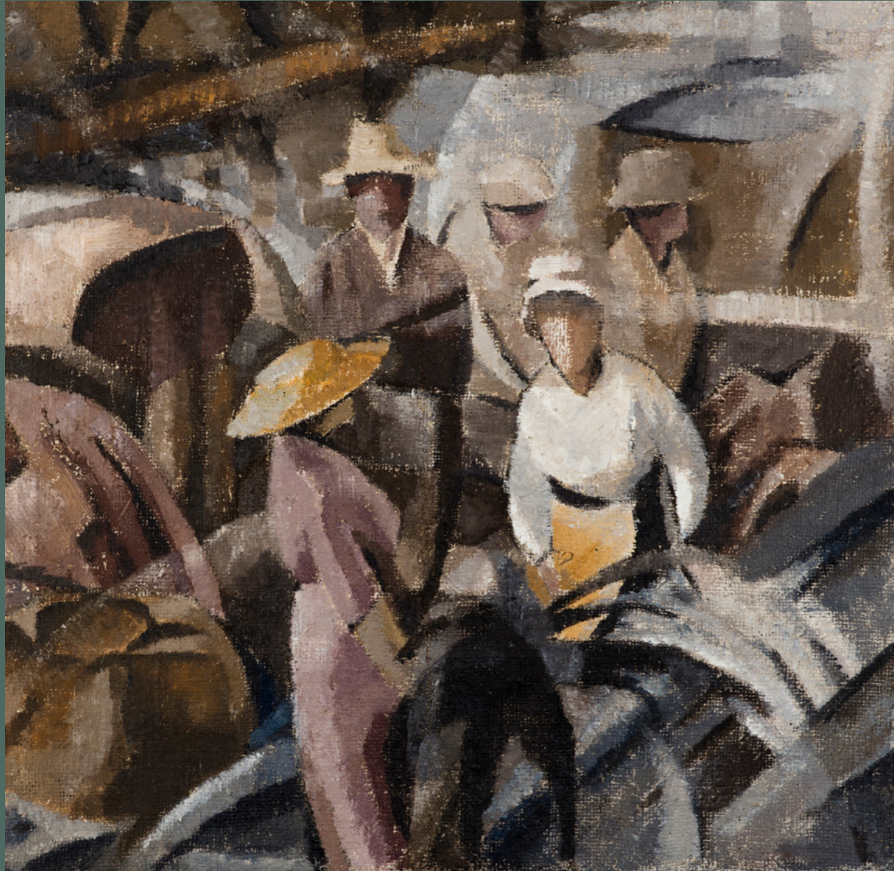
Laila Karttunen: Nimeämätön, 1920-luku, öljymaalaus kankaalle, 56 cm x 57 cm. Laila Karttusen kokoelma, Hämeenlinnan taidemuseo.