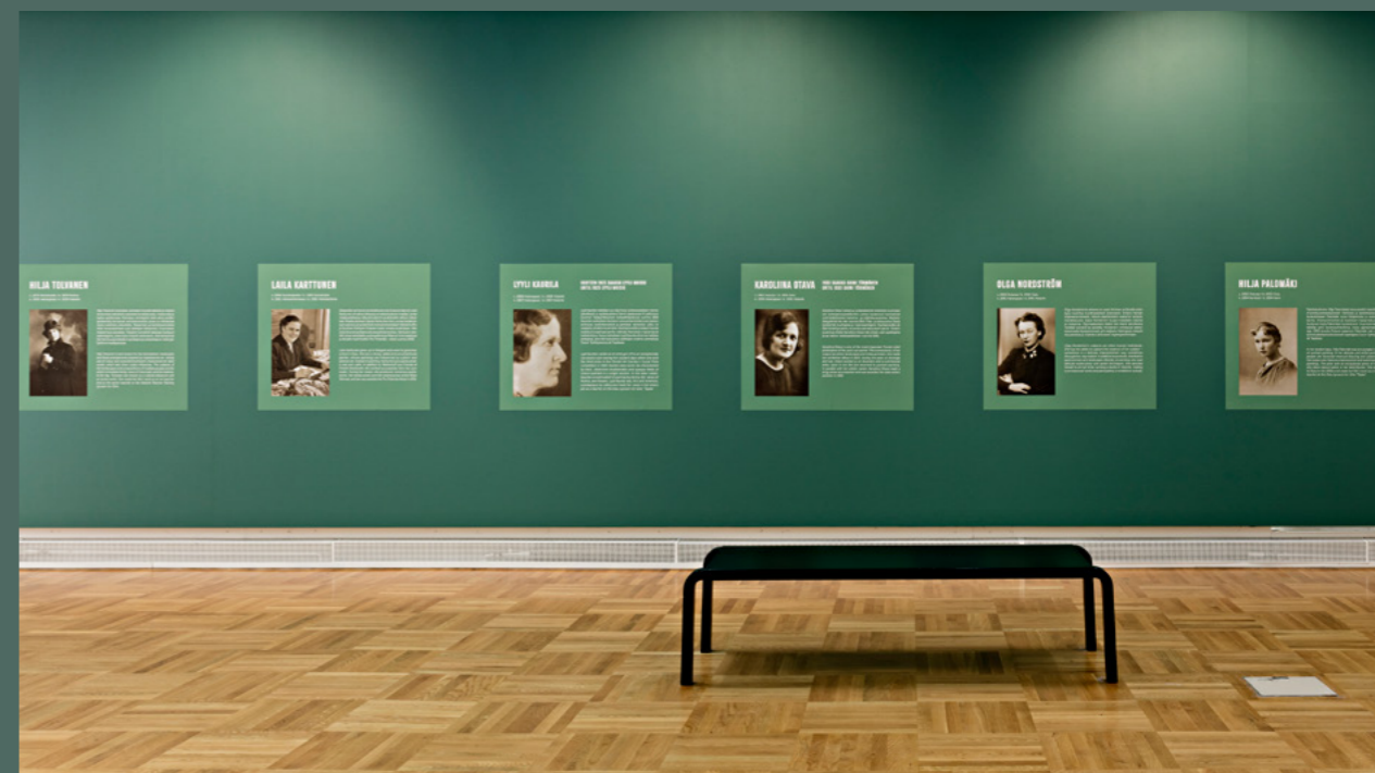
Tahto ja taito -näyttelyn kuusi taiteilijaa esiteltyinä Oulun taidemuseon näyttelysalissa.