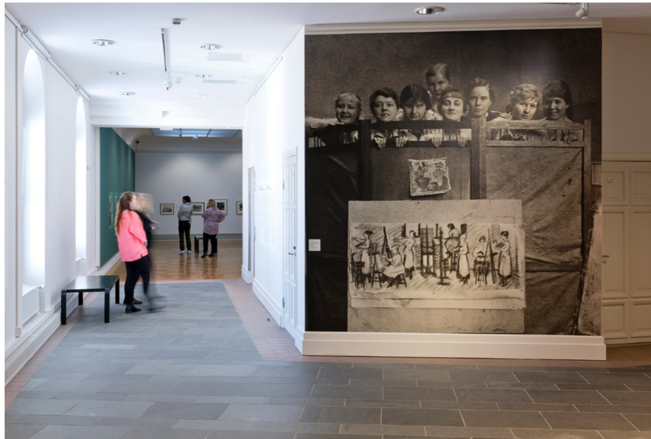
Tahto ja taito -näyttelyn sisäänkäynti Oulun taidemuseon toisessa kerroksessa.