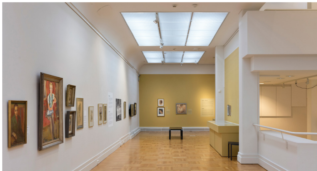
Näkymä taiteellista työskentelyä ja toimeentuloa käsittelevään näyttelyosuuteen.