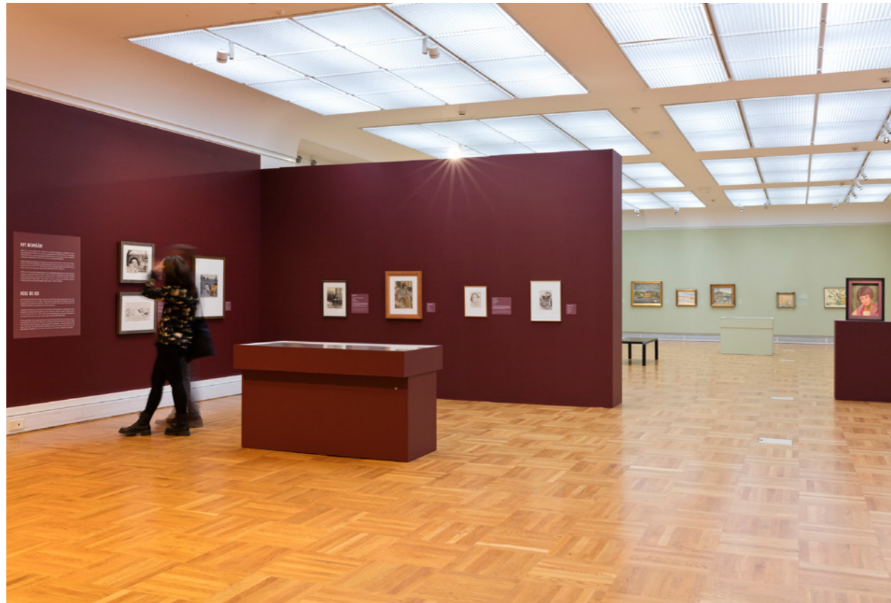
Nyt mennään! -teemassa esiteltiin jatko-opintoihin ja matkustamiseen liittyviä teoksia ja dokumentteja.