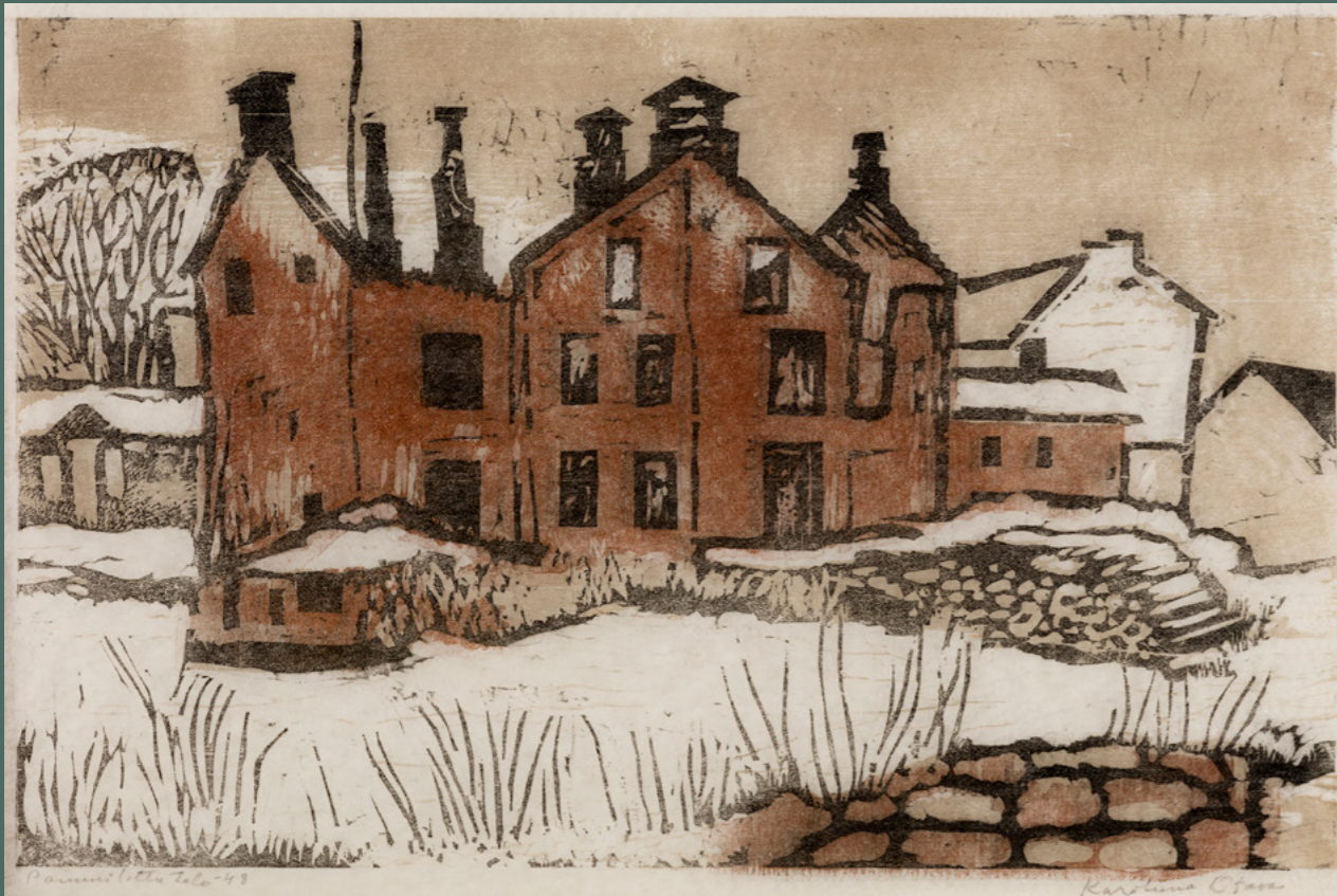
Karoliina Otava: Karoliina Otava: Pommitettu talo, 1948, väripuupiirros japaninpaperille, 41,5m cm x 53,5 cm. Oulun taidemuseon kokoelma.

Oulun taidemuseon kokoelmiin kuuluva Pommitettu talo (1948) on kuva sota-ajan Oulusta. Raunioituneen rakennuksen pihalla kohoaa lumipeitteinen halkopino, josta kukaan ei enää nouda lämmittämiseen varattuja polttopuita. Otavan teokset nostettiin näyttävästi esille monissa aikakauden näyttelyarvosteluissa, mutta aivan erityisesti tätä monokromaattista, punaruskean sävyihin pohjautuvaa sodan kuvausta pidettiin värillisesti oivaltavana ja aistikkaana.