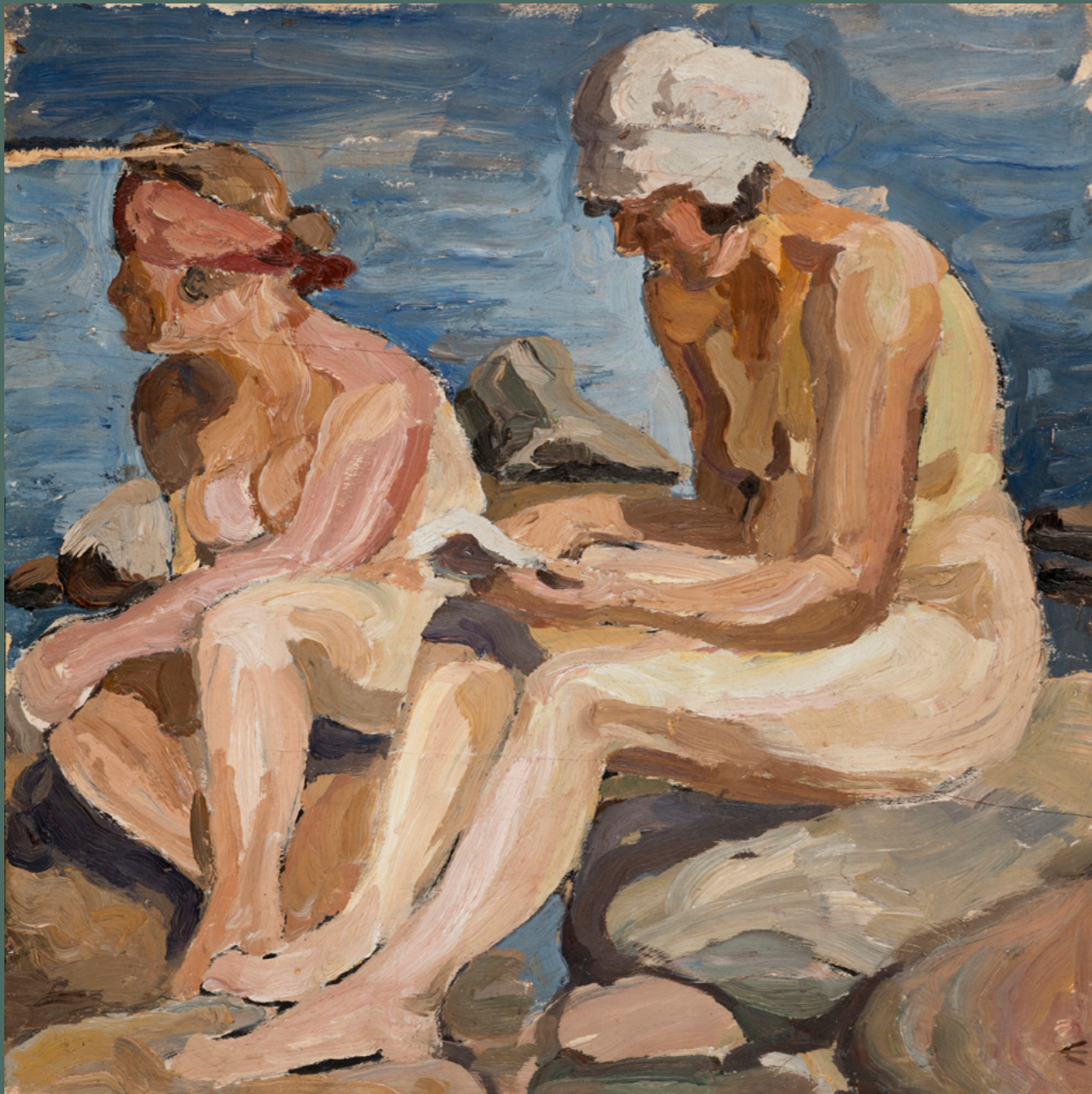
Lyyli Moisio: Kylpijät Suursaassa, 1922, öljymaalauk vanerille, 46,2 cm x 46,1 cm. Oulun taidemuseon kokoelma.

Lyyli Moisio vietti muutamia kesiä itäisellä Suomenlahdella sijaitsevalla Suursaarella 1920-luvun alkupuolella. Saari tunnettiin tuolloin lomaparatiisina, joka tarjosi upeat puitteet taiteelliseen työskentelyyn ja taiteilijatovereiden tapaamiseen.